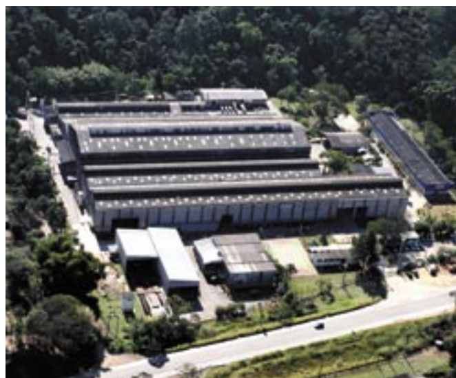
▲ GEA do Brasil, em Franco da Rocha, SP GEA do Brasil, in Franco da Rocha, SP, Brazil

The GEA Group, headquartered in Bochum, Germany, was founded in 1920 and turned into a globally successful technology group with more than 250 companies in 50 countries, employing more than 20,000 people worldwide, generating sales of over 5 billion euros.