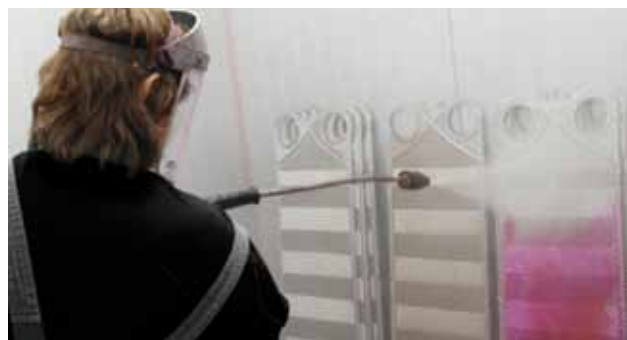
Teste com líquido penetrante