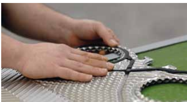
Colagem/Encaixe das gaxetas